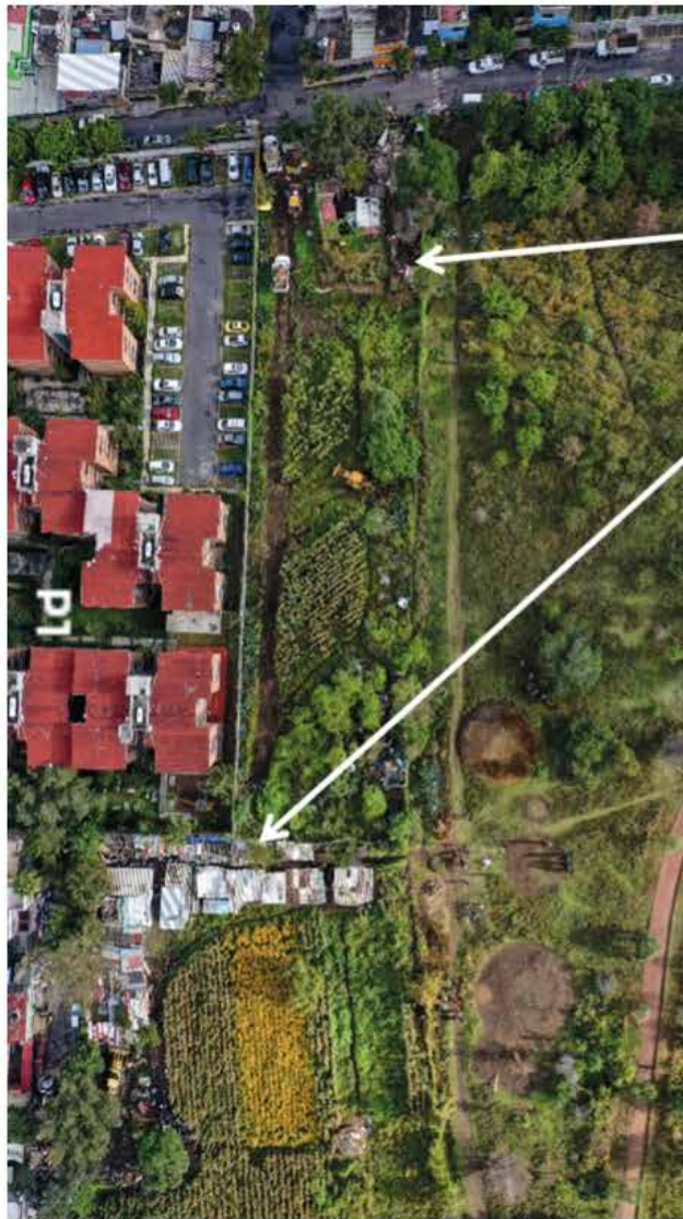
Edificaciones y corrales