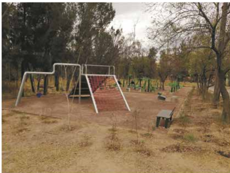
Áreas de juegos y gimnasio