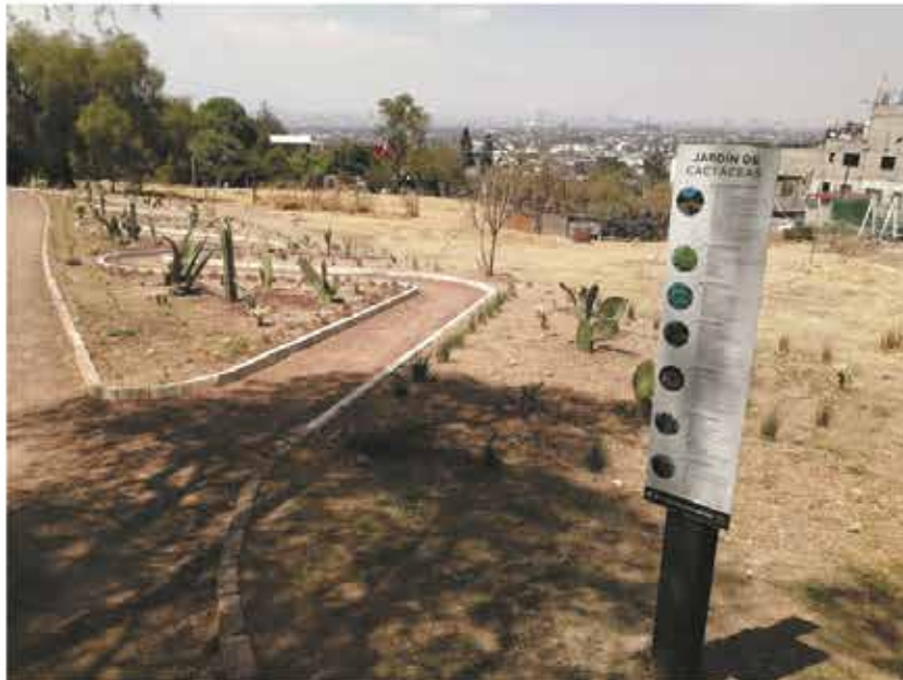
Jardín de cactáceas

Inversión de $44,089,588.88 durante 2019 y 2020