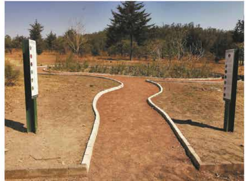
Jardines para polinizadores